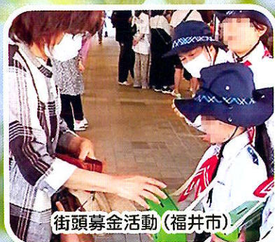
街頭募金活動 (福井市)