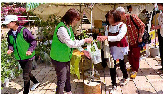
緑化苗木の配布活動 (鯖江市)