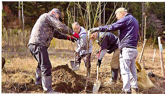
地域での緑化活動 (大野市)