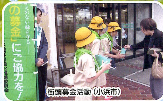
街頭募金活動 (小浜市)