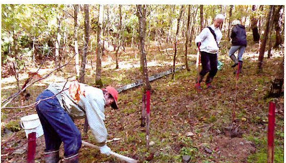
ボランティアによる森づくり活動 (永平寺町)