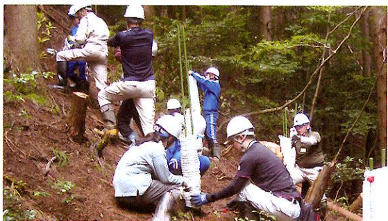
子ども達の森林学習活動 (小浜市)