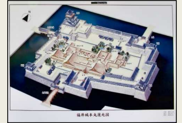
福井城本丸復元図 (原作者:吉田純一氏)

定員 先着30名(要申込) 申込先 生涯学習課 TEL61-3400 受付時間 平日8:30～17:15