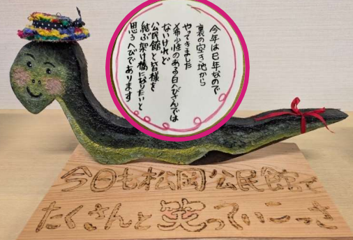
松岡公民館利用者さんの作品です