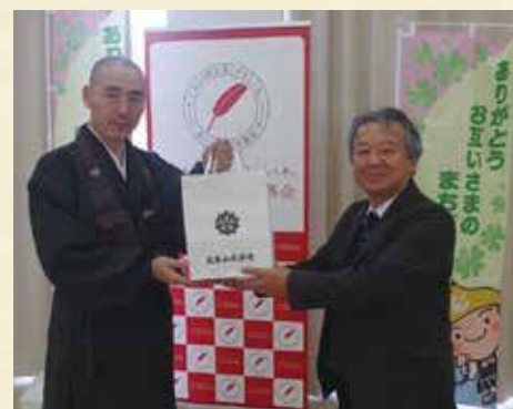
大本山永平寺様からの贈呈の様子