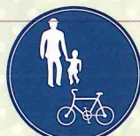
普通自転車歩道通行可

「普通自転車歩道通行可」の標識がある場合などは、普通自転車は歩道を通行することができます。