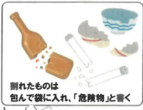
割れたものは 包んで袋に入れ、「危険物」と書く