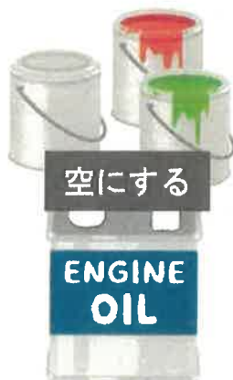
空にする ENGINE OIL