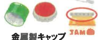
金属製キャップ 金属 (フライパンなど)