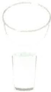
ガラス (コップなど)