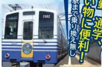
えちぜん鉄道山王駅(徒歩12分)