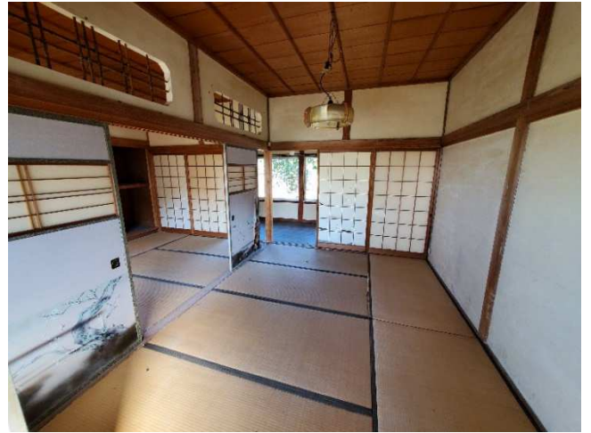
2F 和室 (南)