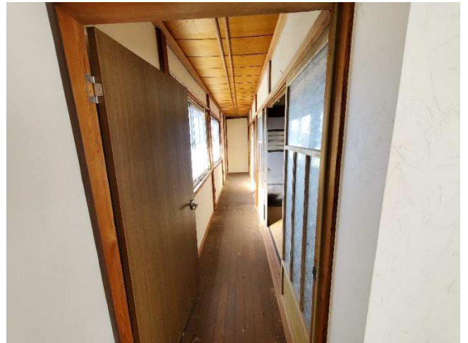
2F 廊下 (西)