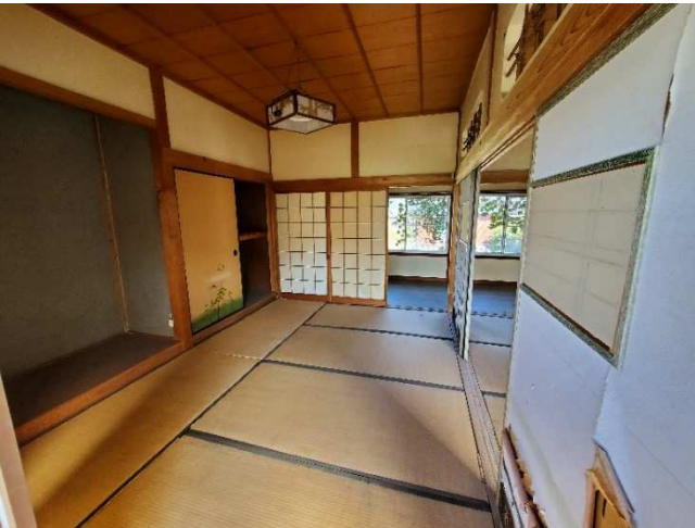
2F 和室 (北)