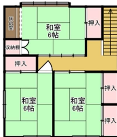
【 2F 】

○ わかりやすい間取り図作成をお願いします。手書きの場合、方眼紙等を活用してください。