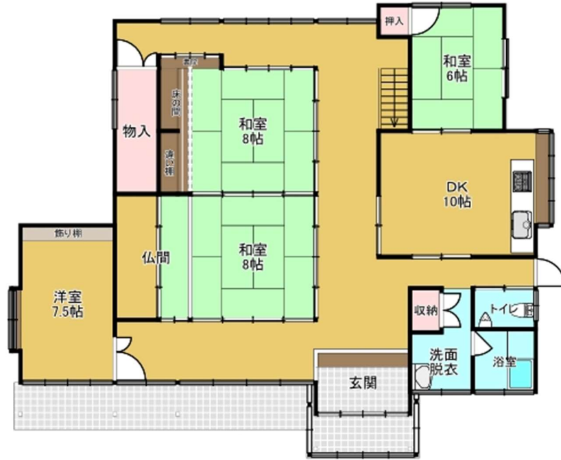
【 1F 】