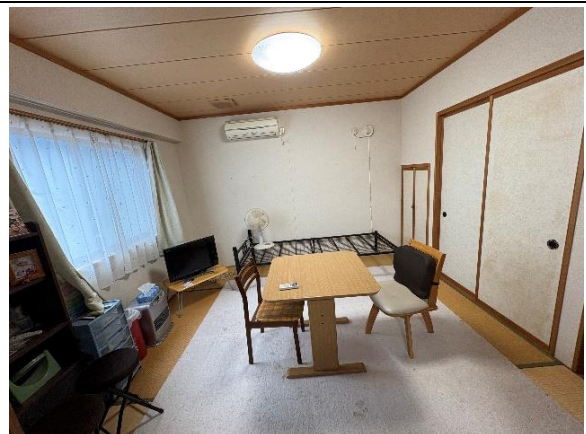
1 階和室 (8 帖)