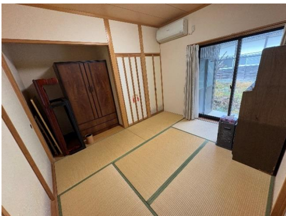
1 階和室 (6 帖)